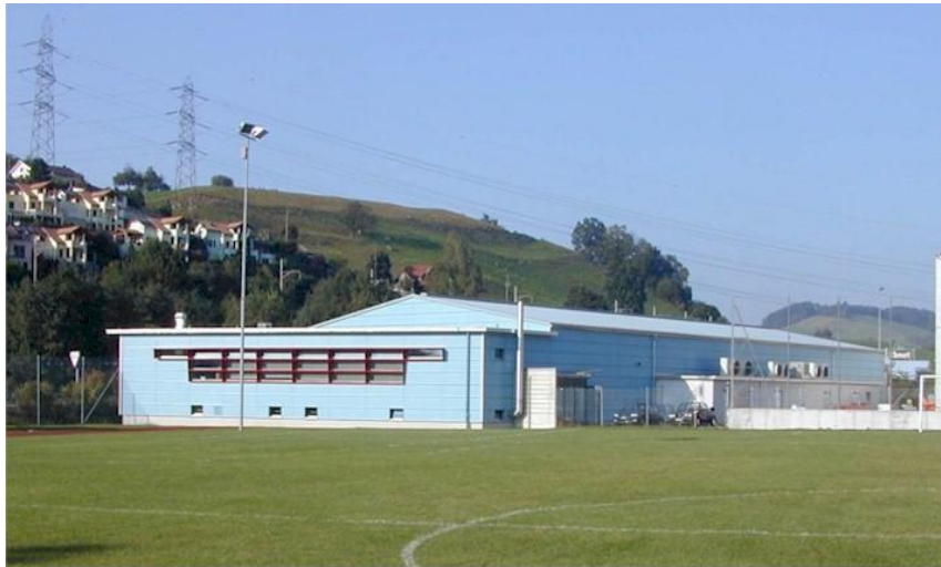
Curlinghalle Küssnacht am Rigi