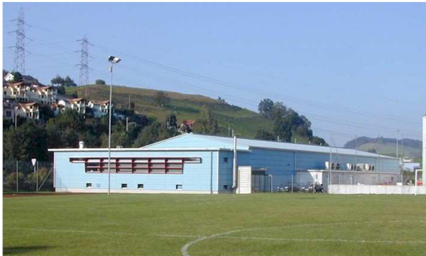
Curlinghalle Küssnacht am Rigi